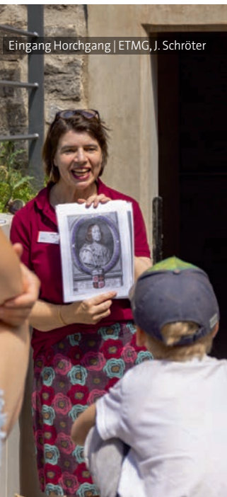
Eingang Horchgang

Alle Angebote finden unter pädagogischer Leitung statt. Die Ausstellungspädagoginnen passen das Anforderungsniveau in Absprache bzgl. der Kompetenzerweiterung an die jeweilige Gruppe an. Angebote von über einer Stunde können in der Kinder-Werkstatt mit einem Kreativangebot nachbereitet bzw. vertieft werden. Der Besuch des Petersberges kann ebenso als Projekttag oder im Rahmen einer Projektwoche gestaltet werden.