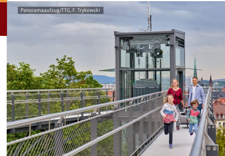
Panoramaaufzug/TTG, F. Trykowski

Ein individuelles Petersberg-Erlebnis mit der kostenfreien