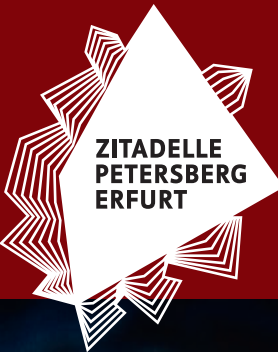
Titelbild: ETMG, Steve Bauerschmidt | Gestaltung: gudman.de | 2024