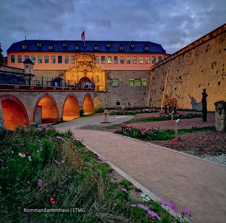
Kommandantenhaus | ETMG