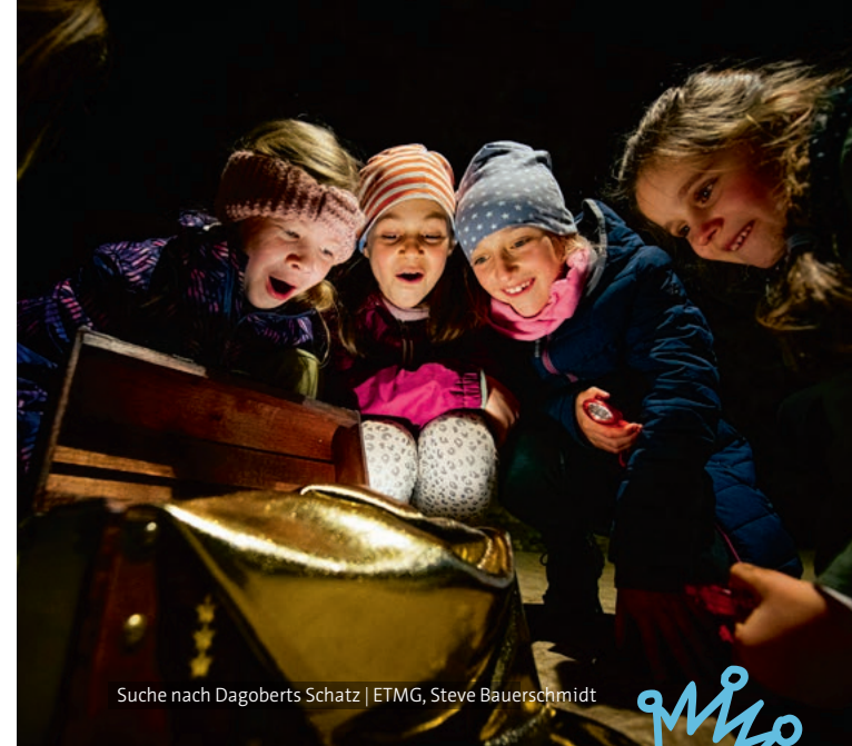
Suche nach Dagoberts Schatz | ETMG, Steve Bauerschmidt

Individuelles Angebot für verschiedene Altersgruppen mit unterschiedlicher Dauer. / [Buchungs-Nr. GF 07/M]