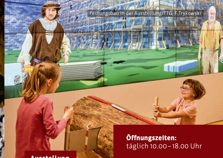
Festungsbau in der Ausstellung